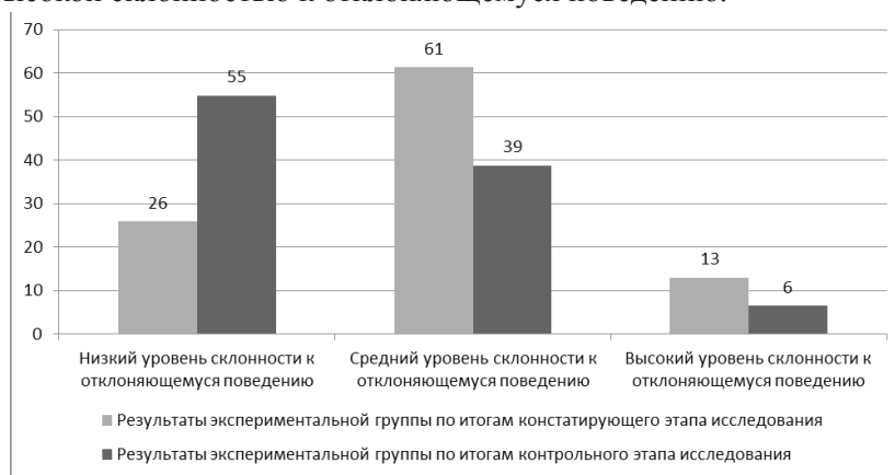
Рис. 3. Результаты, полученные в экспериментальной группе на констатирующем и контрольном этапах исследования, %

В экспериментальной группе на констатирующем этапе исследования высокая склонность к отклоняющемуся поведению выявлена у 13 % подростков. Тогда как на контрольном этапе в данной группе выявлено всего 6 % испытуемых с высокой склонностью к отклоняющемуся поведению.